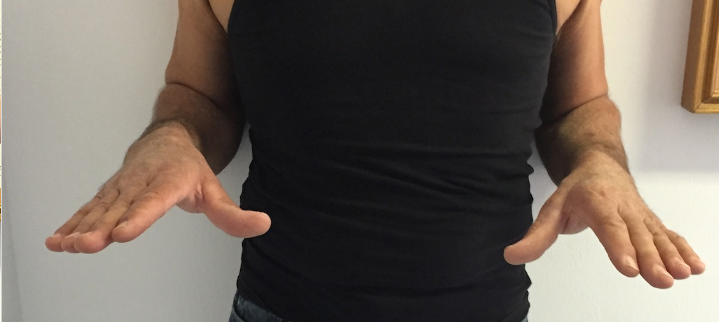
Quadro clinico a distanza di 3 mesi