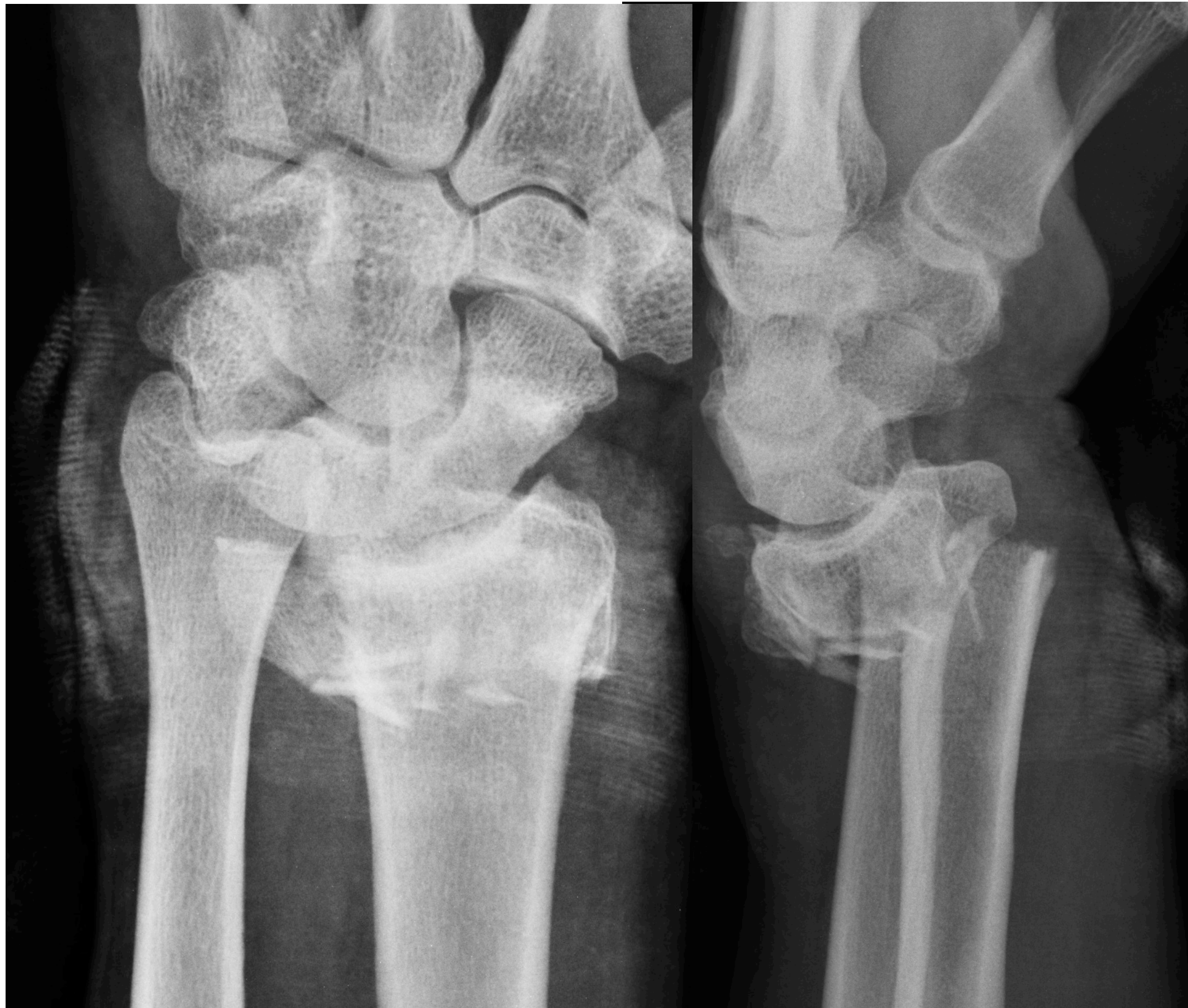
Uomo, 50 anni, frattura ad alta energia del polso sinistro.