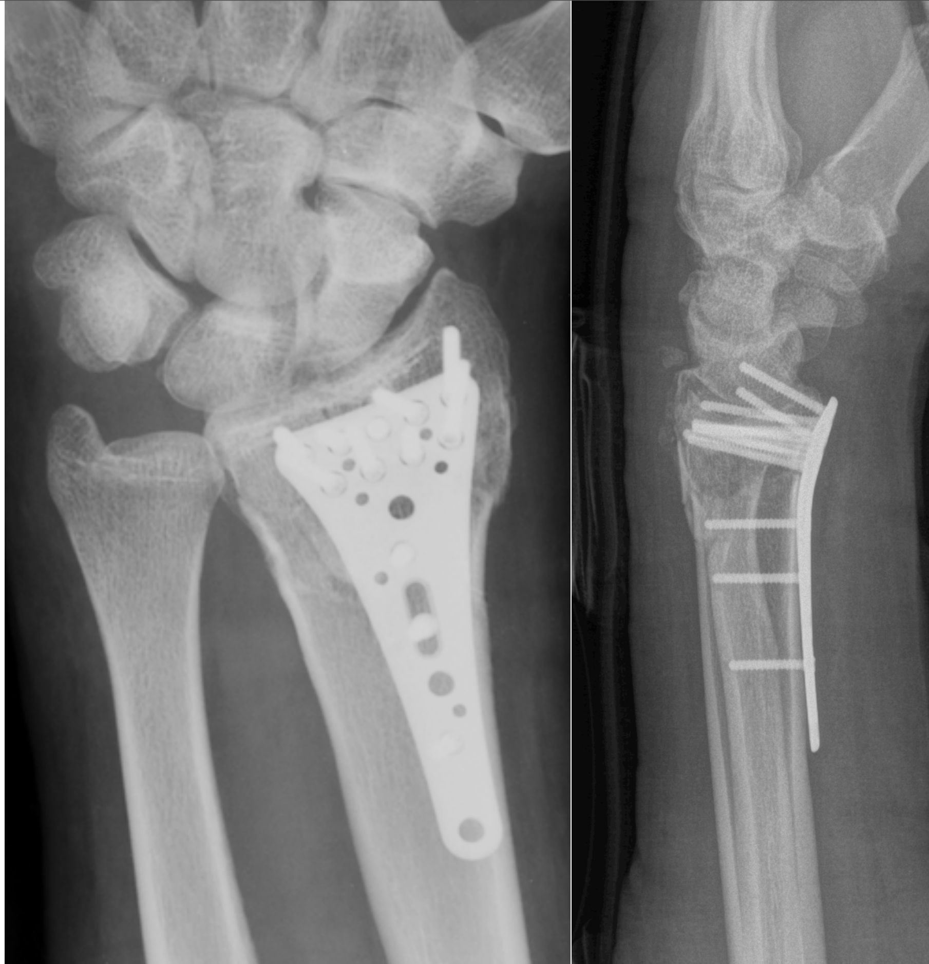
Quadro radiologico a distanza di 3 mesi